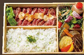
ハーフポンドリブローズ弁当