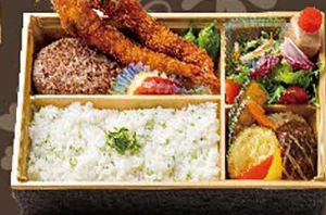
国産牛ハンバーグと天使のエビフライ弁当